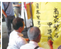
真刻に願い事を書く社長