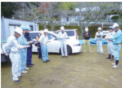
安全協会とのパトロール風景

全社員の努力で熊本利水工業は重大災害の発生はゼロです。これからも「無事故、無災害」を継続すべく、社内での安全意識の啓蒙に取り組みでいきたいと思えます。