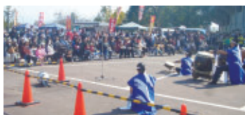
秋のフリーマーケット