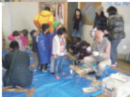
正月遊びを楽しむ 親子連れ