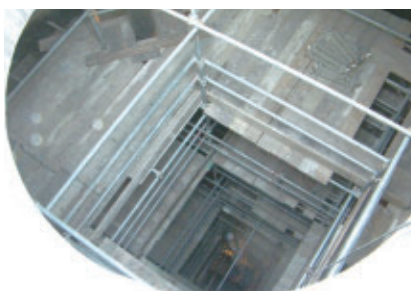
タンク内に組んだ足場