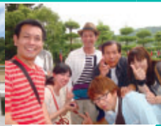
入社間もなくでしたが、すっかりうちとけました。