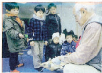
竹とんぼや たこ揚げ体験