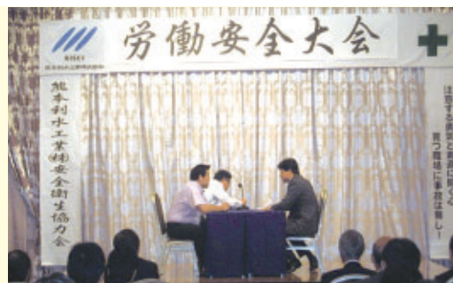
熊本利水工業主催安全大会風景

また、安全衛生協会の会員の方と一緒に現場の安全パトロールを実施しました。協会の会員の方からの指摘やアドバイスを受け、より一層の安全を目指し、レベルアップをしていきたいと思えます。