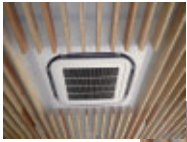
天井カセット型 エアコン