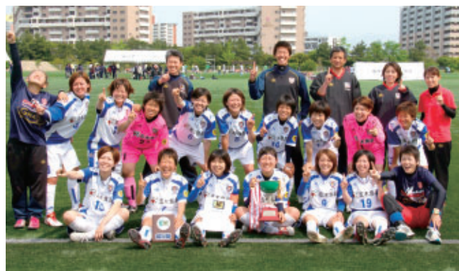
第24回九州ナデシコサッカー大会優勝 H24年5月13日