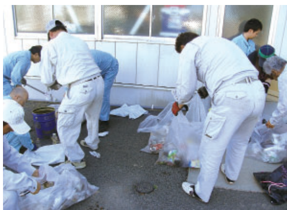
収集したゴミも、きちんと分別作業をしています。

実施した路線は熊本県との協定で、山鹿支店では山鹿市南島の一般県道山鹿植木線55号を