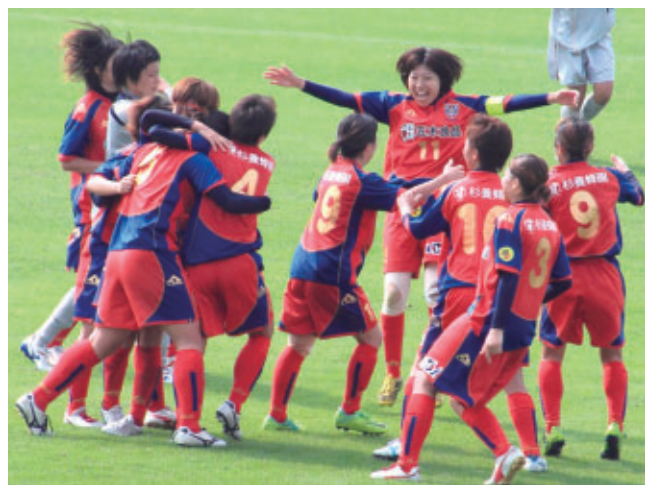
九州女子サッカーリーグ最終節 アンクラユース戦 H24年10月28日

今年も4月から10月まで九州女子サッカーリーグを戦い、昇格を目指して挑戦していきますので、今後とも応援をよろしくお願いいたします。