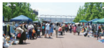
春のフリーマーケット

県営八代運動公園の今後の予定は県営八代運動公園ホームページで http://yssp-risui.info/